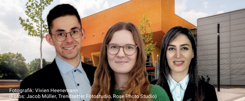
Fotografik: Vivien Heenemann (Fotos: Jacob Müller, Trendsetter Fotostudio, Rose Photo Studio)