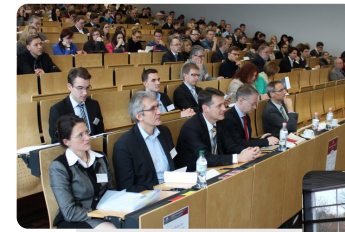
Eindrücke von der Sächsischen Steuertagung 2014