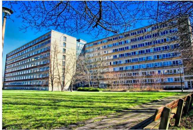
University Archives, Campus Library II (economics, law, mathematics, natural sciences and engineering),