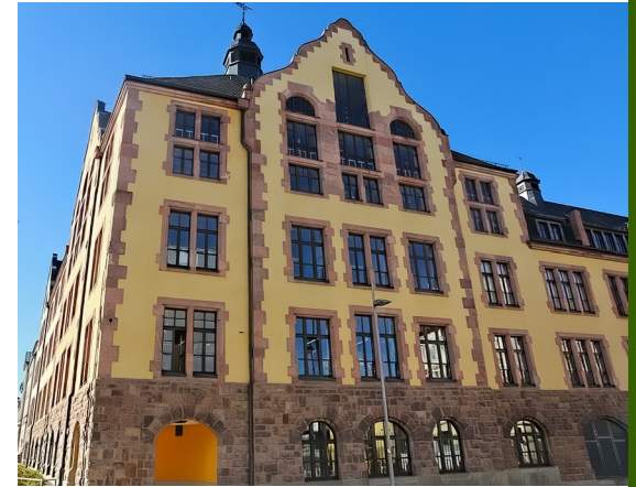
Central Library (chemistry and computer science)