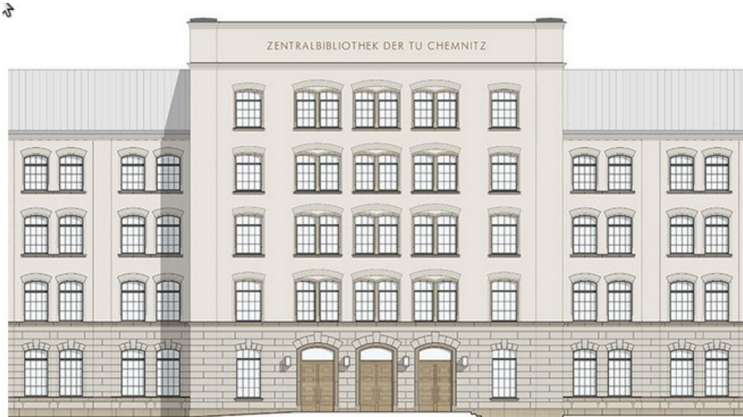
Blick auf die Fassade.