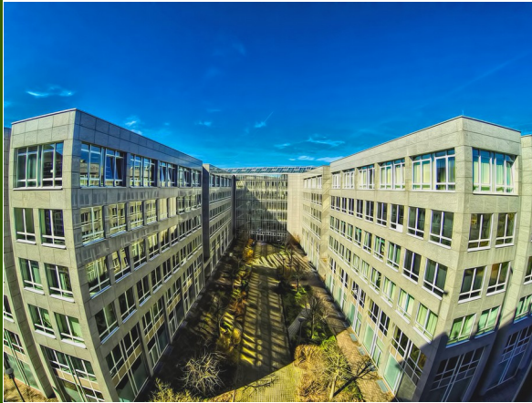
Campus Library I (arts and humanities)