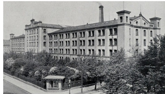
Eine der frühen Fabrikbauten der Stadt Chemnitz, die Aktienspinnerei, in einer Aufnahme aus dem Jahr 1890.

Für die Universitätsbibliothek und das Universitätsarchiv Chemnitz wird ein alter Industriebau modernisiert – die Alte Aktienspinnerei. Das Gebäude behält den Charakter eines Fabrikgebäudes aus dem 19. Jahrhundert und wird eine moderne Bibliothek beherbergen, die rund um die Uhr geöffnet haben wird. Es entsteht eine sehr besondere Bibliothek, die nicht nur ein Speicher für gedruckte und elektronische Medien ist, sondern vielmehr eine Atmosphäre bietet, in der sich wissenschaftlich interessierte Menschen treffen, gedruckte und digitale Informationen finden, miteinander diskutieren und neue Ideen entwickeln können.