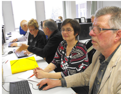
Lernende aus CZ und D an der TU Chemnitz