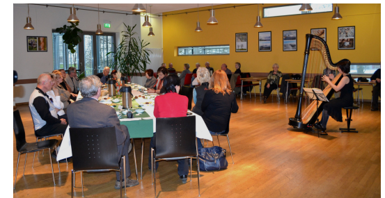
Eröffnung der Photoausstellung in Chemnitz