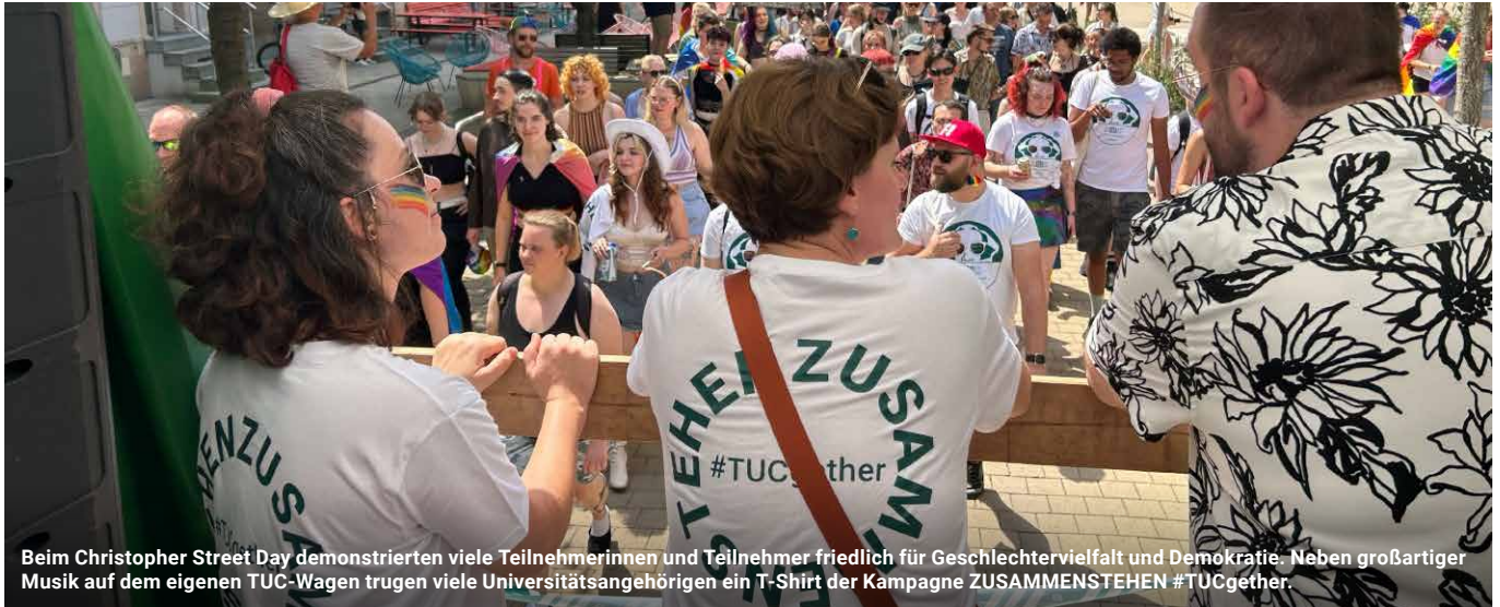
Beim Christopher Street Day demonstrierten viele Teilnehmerinnen und Teilnehmer friedlich für Geschlechtervielfalt und Demokratie. Neben großartiger Musik auf dem eigenen TUC-Wagen trugen viele Universitätsangehörigen ein T-Shirt der Kampagne ZUSAMMENSTEHEN #TUCgether.