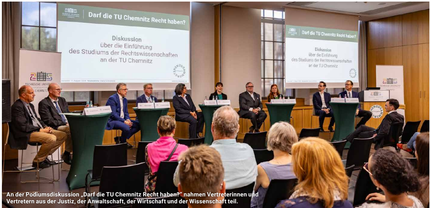
An der Podiumsdiskussion „Darf die TU Chemnitz Recht haben?“ nahmen Vertreterinnen und Vertretern aus der Justiz, der Anwaltschaft, der Wirtschaft und der Wissenschaft teil.

Sachsen fehlt der juristische Nachwuchs: Bis zum Jahr 2033 gehen voraussichtlich rund 850 sächsische Richterinnen, Richter, Staatsanwältinnen und Staatsanwälte, 1.370 Rechtsanwältinnen und Rechtsanwälte sowie 60 Notarinnen und Notare in den Ruhestand, so die Prognose des sächsischen Justizministeriums vom Herbst 2023. Eine ähnliche Ruhestandswelle wird für Juristinnen und Juristen in der Staats- und Kommunalverwaltung und der Wirtschaft erwartet. Ein Studium der Rechtswissenschaften ist in Sachsen nur noch an der Universität Leipzig möglich. Diese steigenden Herausforderungen der Fachkräftebedarfsdeckung im Bereich Rechtswissenschaften wird auch vom sächsischen Kabinett in der im Februar 2024 beschlossenen Hochschulentwicklungsplanung 2025plus anerkannt, wonach die Einrichtung des Studienfachs Rechtswissenschaft an einer weiteren Hochschule geprüft werden solle.“ Dafür macht sich die TU Chemnitz stark und hat am 5. August 2024 zu einer Podiumsdiskussion zum Thema „Darf die TU Chemnitz Recht haben?“ mit Vertreterinnen und Vertretern aus der Rechtspflege, der Anwaltschaft, der Wirtschaft und der Wissenschaft eingeladen, um Lösungsansätze aufzuzeigen und eine entsprechende Initiative zu starten. Deren Kernaussagen sind unter www.mytuc.org/yhhl zu finden.