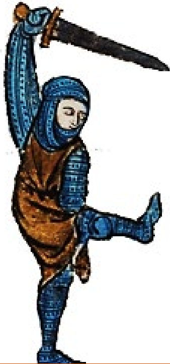
BEINECKE RARE BOOK & MANUSCRIPT LIBRARY, MS 229, FOL. 326r.

Geschichte Europas im Mittelalter und in der Frühen Neuzeit Deutsche Literatur- und Sprachgeschichte des Mittelalters und der Frühen Neuzeit Europäische Regionalgeschichte