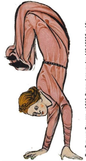
THE RUTLAND PSALTER, CT 260, BRITISH LIBRARY ADD MS 62925, F 65r.