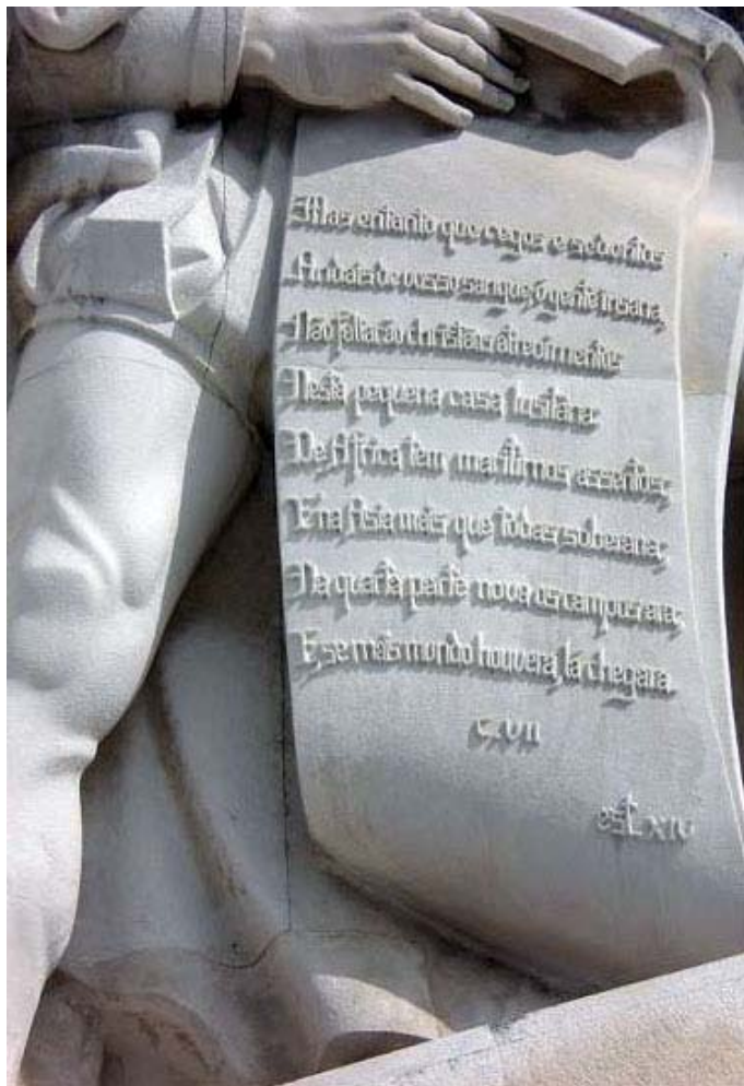
Detaillansicht – Camões Pergamentrolle auf dem Padrao dos Descobrimentos, Lissabon.

1880 erhielt Camões eine prominente Begräbnisstätte: Seine Asche wurde in das Jerónimus-Kloster in Belém, Lissabon, überführt, und zur rechten Seite des jungen Königs Sebastian beigelegt - jenem König, dem er seine Lusiaden gewidmet hat. Zur anderen Seite Sebastians steht die Urne des im Epos am meisten besungenen Helden: Vasco da Gama [10] .