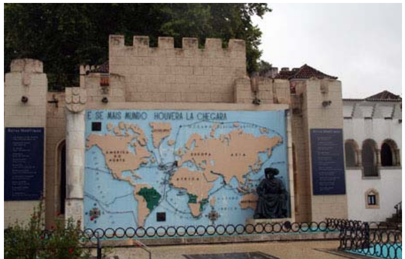
Portugal dos Pequenitos, Coimbra.

Der portugiesische Diktator Salazar hat genau dieses Bindeglied immer wieder politisch propagiert und ließ daher noch während seiner Regierungszeit (1932-68) das 1941 eingeweihte Entdeckerdenkmal in Lissabon und den 1940 eingeweihten Themenpark in Coimbra bauen.