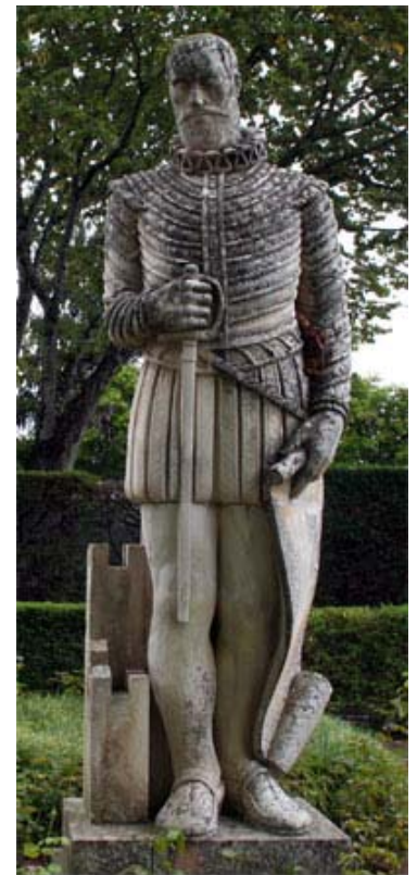
Camões Denkmal im Themenpark Coimbra.

Stolz, in voller Kriegermontur und mit gezogener Waffe auf der einen - und nachdenklich, in Halskrause und mit Pergamentrolle auf der anderen Seite, wird uns Camões hier präsentiert. Der "dichtende Krieger" [8] (am Denkmal ist sein fehlendes linkes Auge gut erkennbar), war zugleich ein Dichter der wahren Vaterlandsliebe. [9]