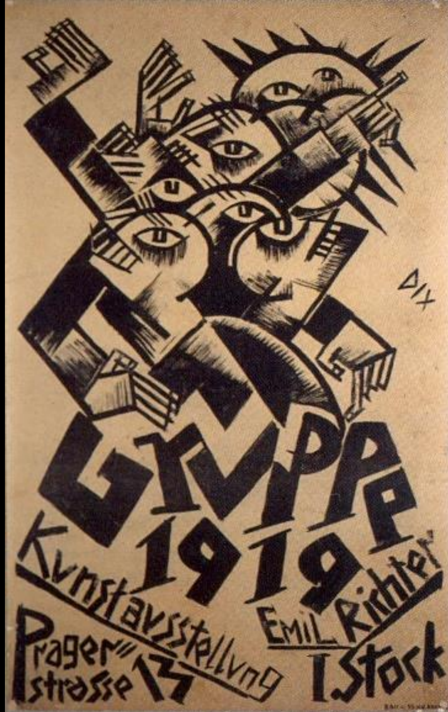
Plakat von Otto Dix zur 1. Ausstellung der ‚Dresdner Sezession – Gruppe 1919‘, In: Birgit Dalbajewa [Hrsg.], Neue Sachlichkeit in Dresden, Dresden 2011, Seite 23.