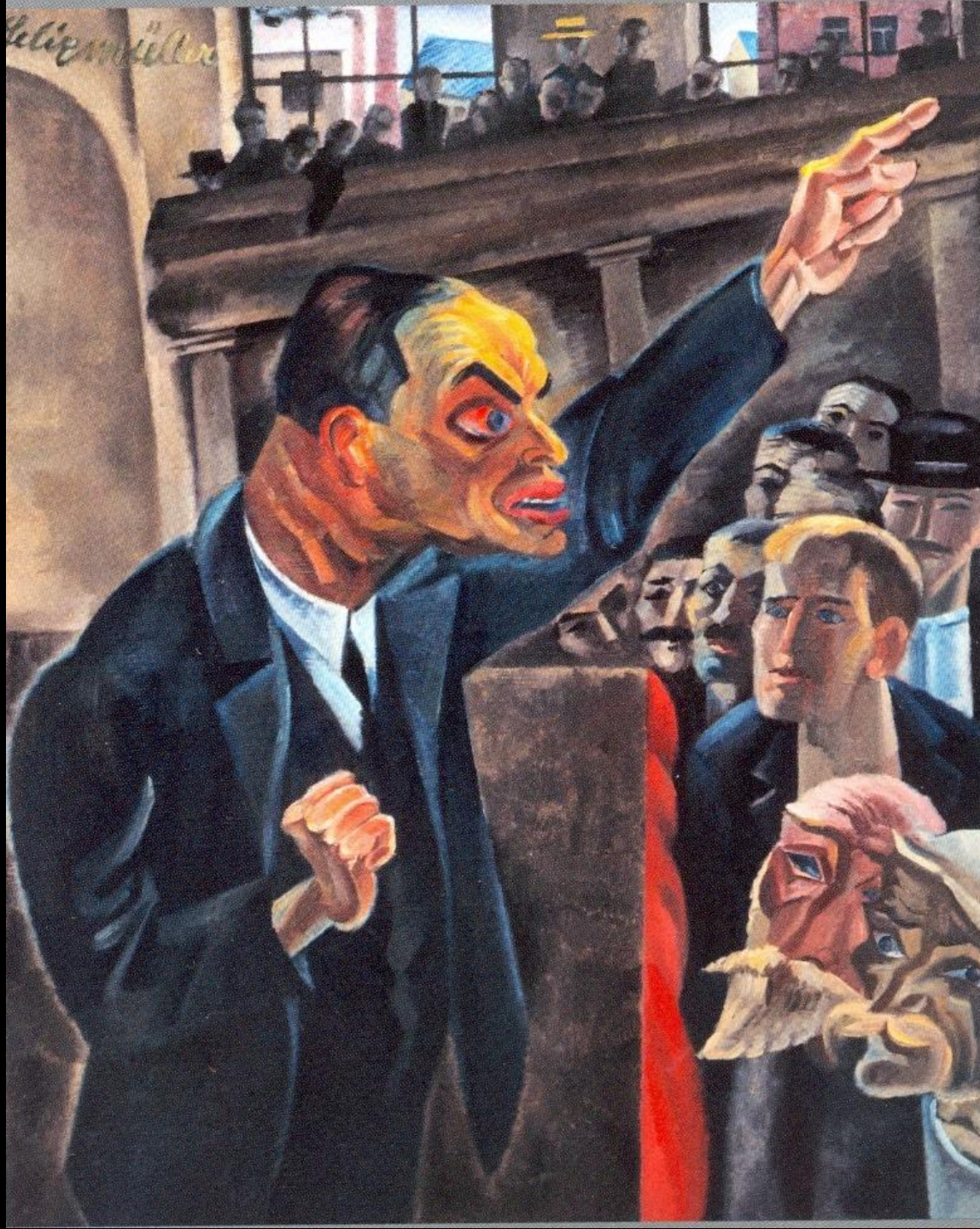
Conrad Felixmüller, Der Agitator Otto Rühle spricht, Replik des 1920 entstandenen Gemäldes, 1946 (Staatliche Museen zu Berlin, Nationalgalerie), In: Birgit Dalbajewa [Hrsg.], Neue Sachlichkeit in Dresden, Dresden 2011, Seite 20.