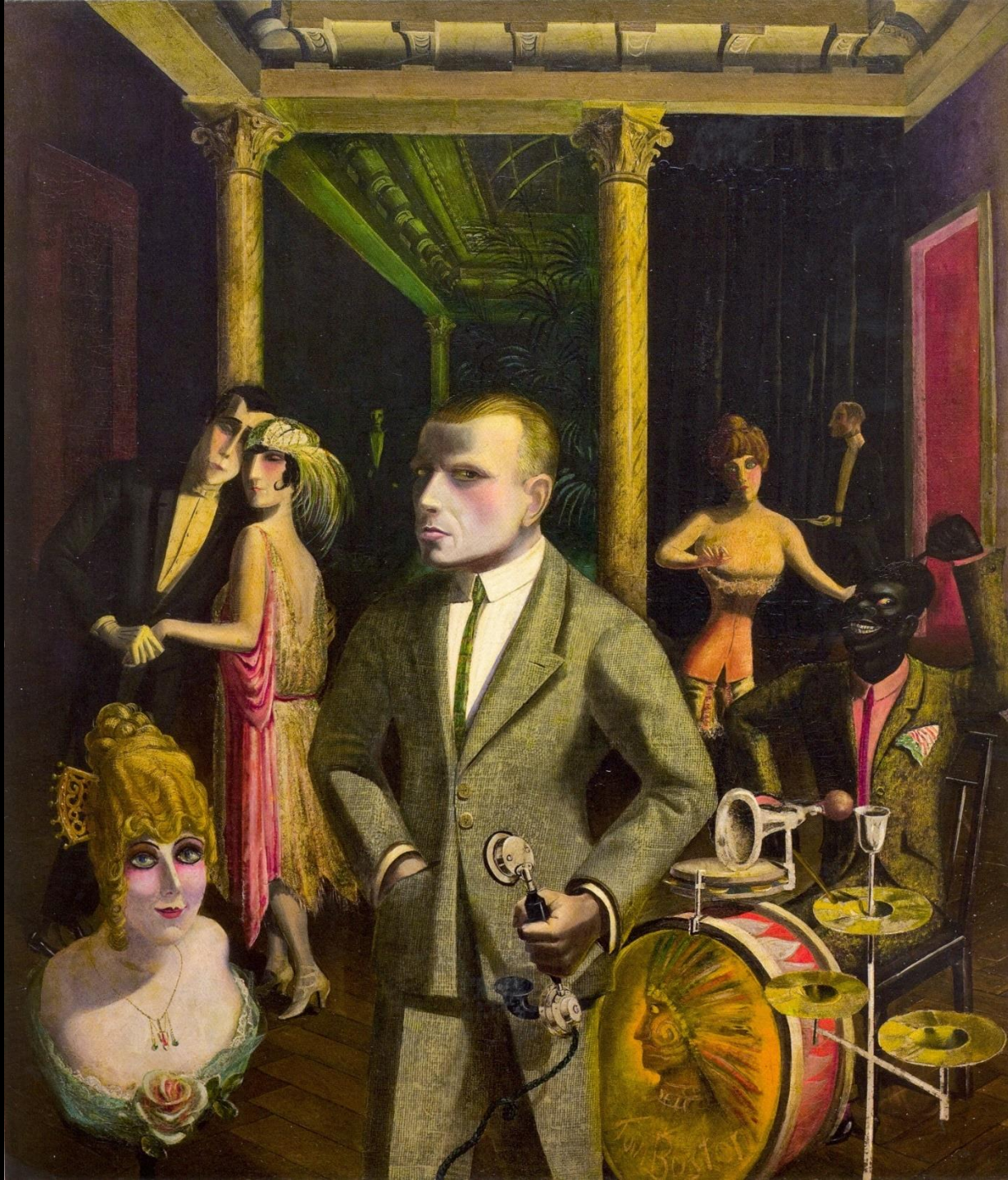
Otto Dix, An die Schönheit | 1922 | Öl auf Leinwand | 139,5 x 120,5 cm | Von der Heydt-Museum Wuppertal, Inv.-Nr. G 1340, In: Birgit Dalbajewa [Hrsg.], Neue Sachlichkeit in Dresden, Dresden 2011, Seite 191.