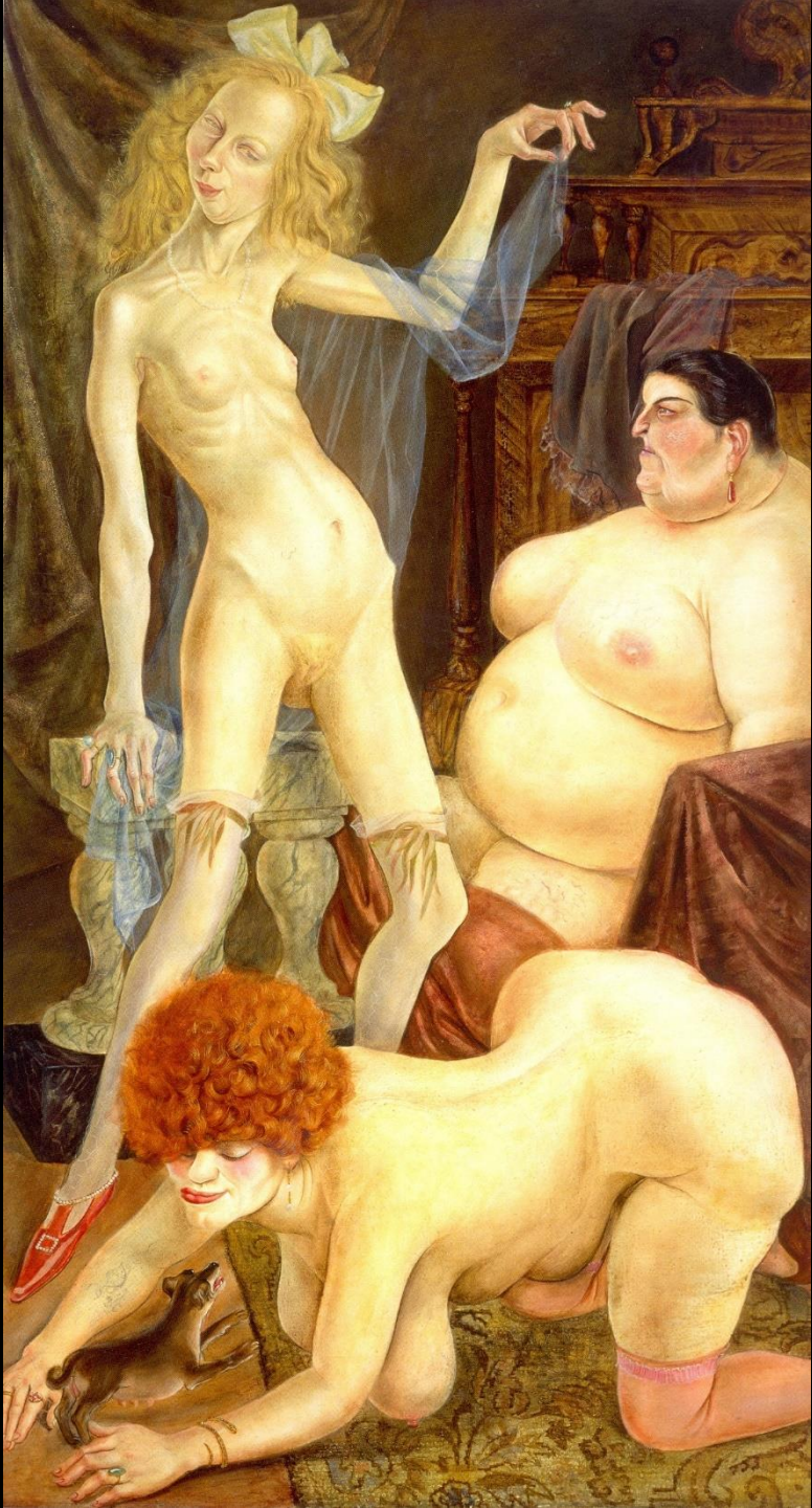
Otto Dix, Drei Weiber | 1926 | Öl und Tempera auf Sperrholz | 181 x 100,5 cm | Kunstmuseum Stuttgart, Inv.-Nr. O- 2550, In: Birgit Dalbajewa [Hrsg.], Neue Sachlichkeit in Dresden, Dresden 2011, Seite 193.