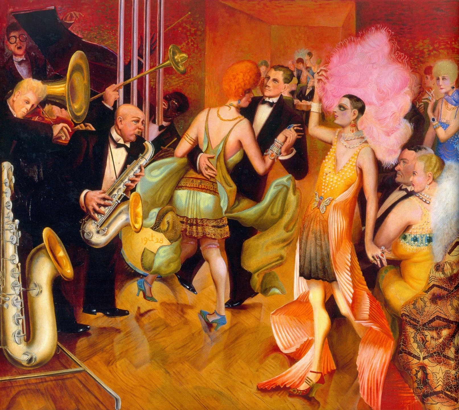
Kunstmuseum Stuttgart, In: Birgit Dalbajewa [Hrsg.], Neue Sachlichkeit in Dresden, Dresden 2011, Seite 2.