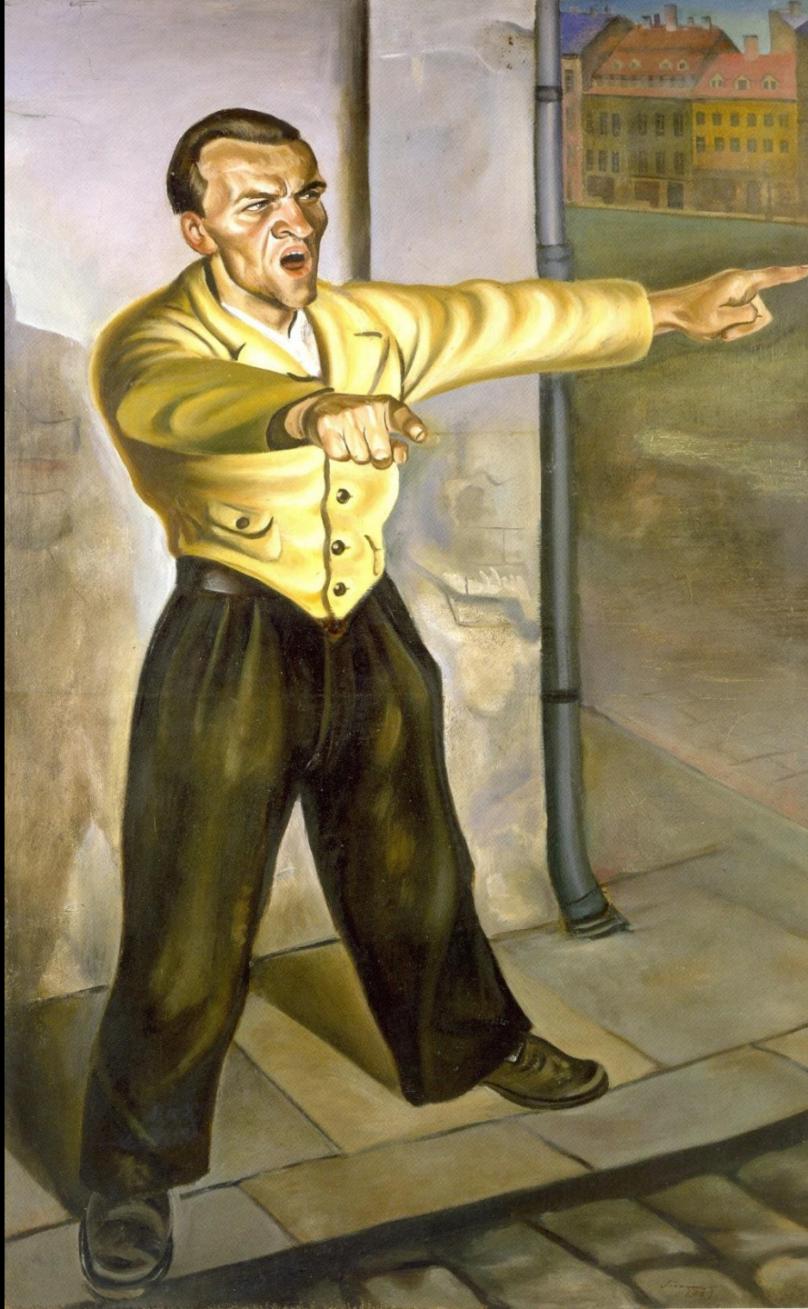
Curt Querner, Der Agitator | 1931 | Öl auf Leinwand | 160 x 100 cm | Staatliche Museen Berlin, Nationalgalerie, Inv.-Nr. A IV 77, In: Birgit Dalbajewa [Hrsg.], Neue Sachlichkeit in Dresden, Dresden 2011, Seite 132.