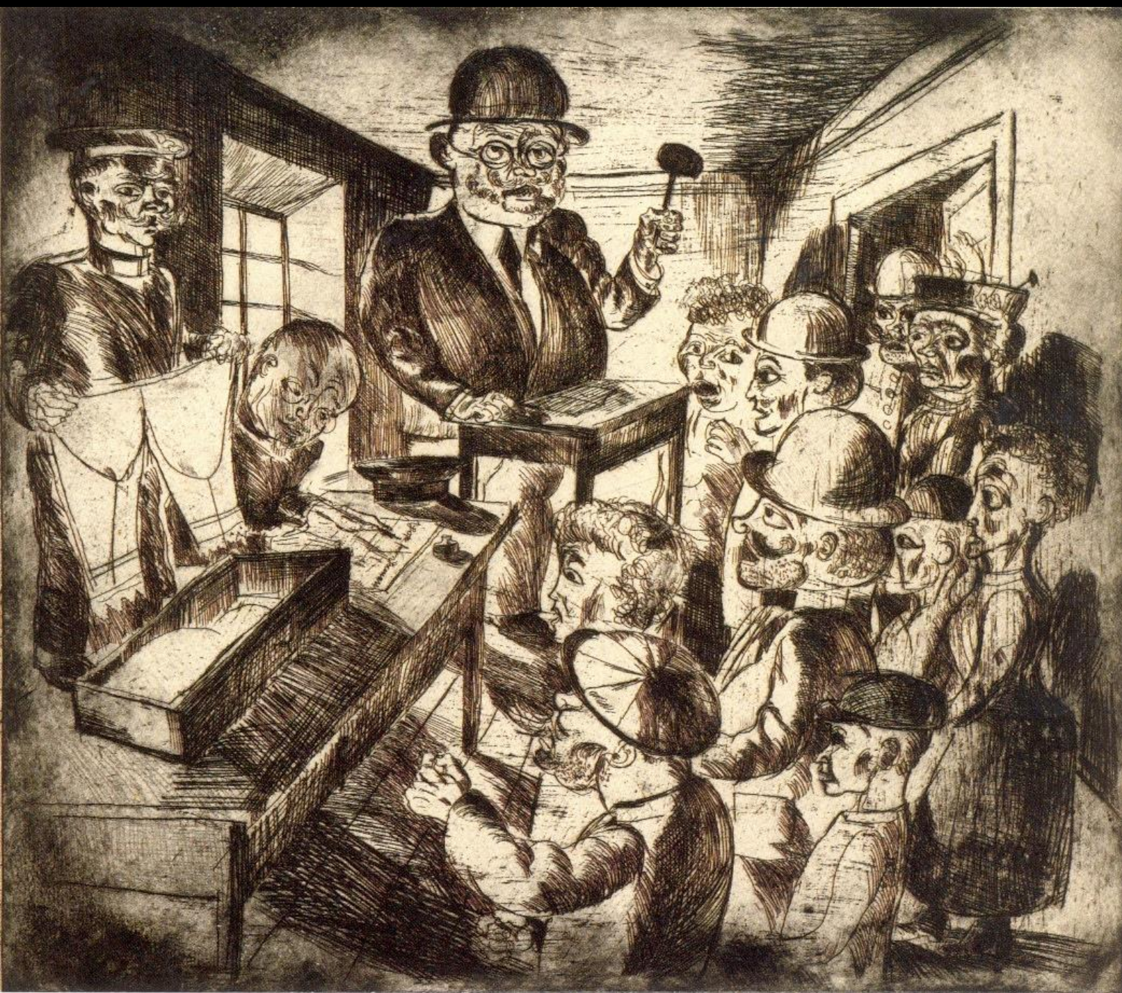
Bernhard Kretschmar, Auktion | 1921 | Radierung | 34,5 x 39,1 cm | SKD, Kupferstich-Kabinett, Inv.-Nr. A 1949-32, In: Birgit Dalbajewa [Hrsg.], Neue Sachlichkeit in Dresden, Dresden 2011, Seite 87.