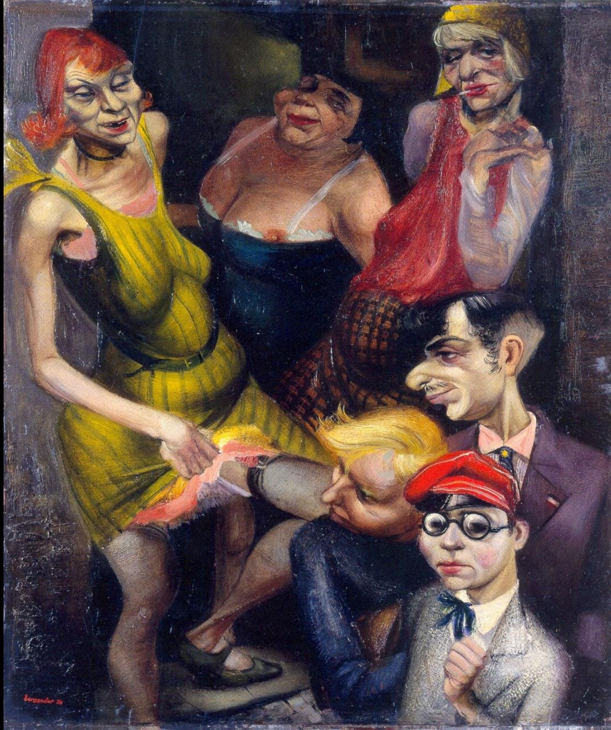
Rudolf Bergander, Bordellszene | 1930 | Öl auf Holz | 52,5 x 42 cm | Museum der bildenden Künste Leipzig, Inv.-Nr. 2450, In: Birgit Dalbajewa [Hrsg.], Neue Sachlichkeit in Dresden, Dresden 2011, Seite 173.