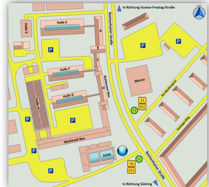
Campus der Technischen Universität in der Reichenhainer Straße, Veranstaltungsort Zentrales Hörsaal- und Seminargebäude