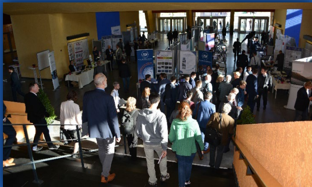
Zentrales Hörsaal- und Seminargebäude der TU Chemnitz