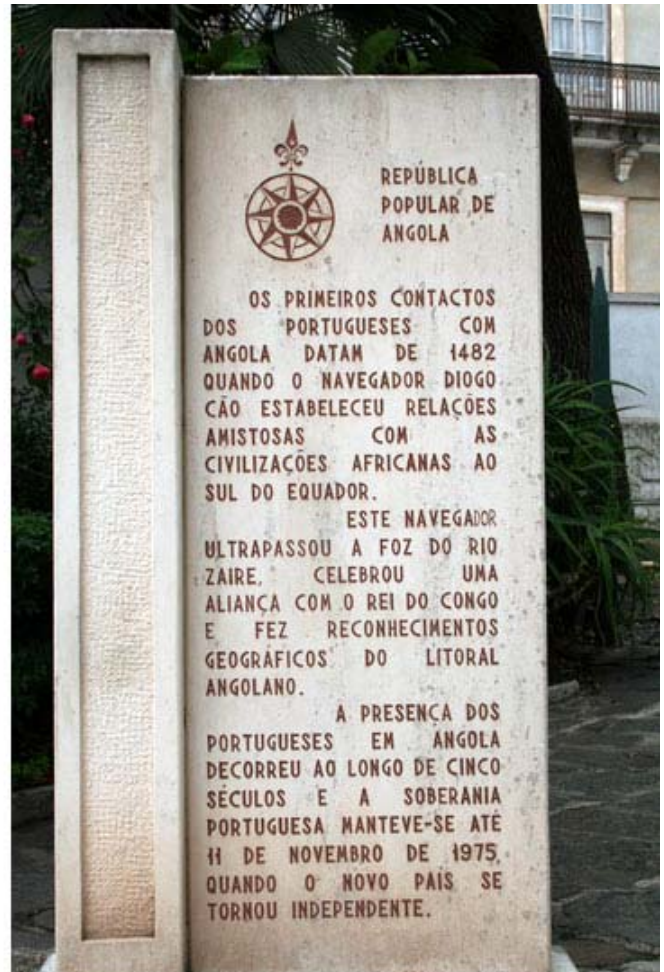
Die Steinplatten zu Angola vor (links) und nach (rechts) der Unabhängigkeit.