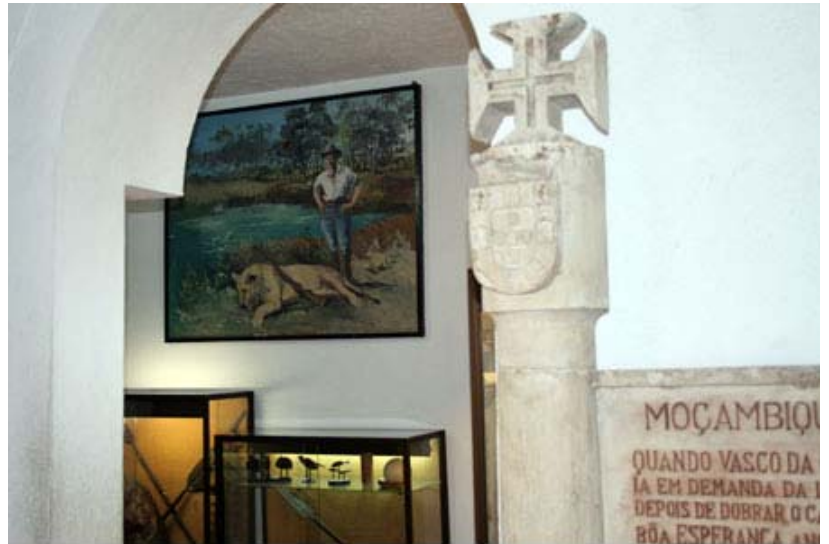
Innenansicht des Mosambik-Pavillons.

Im Innenraum der Pavillons befinden sich Marmorsteinplatten mit dem Entdeckungspfeiler als Symbol der portugiesischen Übersee-Expansion. Ein kurzer, in die Steinplatten eingraviertes Text präsentiert den Besuchern die jeweilige Kolonie. So ist beispielsweise auf der Steinplatte des Indien-Pavillons zu lesen: