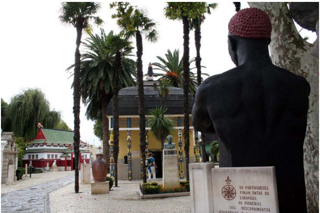
Blick auf den Eingangszplatz des Portugal dos Pequenitos. In der Mitte des Platzes ist eine Büste von Bissaya Barreto, im Hintergrund der Pavillon von Guinea-Bissau.

Der Themenpark Portugal dos Pequenitos (dt.: Portugal der Kleinen) wurde vom Arzt und Medizin-Professor der Universität Coimbra Bissaya Barreto in klarer pädagogischer Absicht und zur Freizeitbeschäftigung für Kinder entworfen.[1] Die Umsetzung realisierte einer der berühmtesten portugiesischen Architekten der Moderne: Cassiano Branco. Seit seiner Einweihung am 8. Juni 1940 finden bis heute zahlreiche Schulklassen auf ihren Ausflügen den Weg in die Miniaturwelt des Portugal dos Pequenitos .